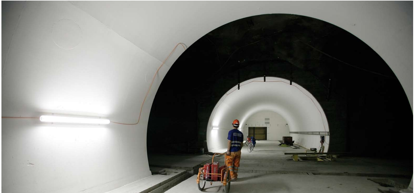
Ein Monteur der „ARGE Niederspannung“ (ARGE NS) bei der Arbeit im Lötschberg-Basistunnel.